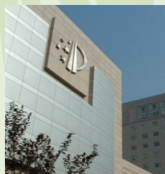
中国国家知識産権局